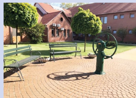
Lefestett padok és kutak az Idősek Pihenő Parkjában

leten lévő padokat szintén lefestették-mázolták, ülőke elemeit lecserélték. A Mizsei utca felőli parkolóban pedig 1 db kipusztult fa helyére új fát ültettek.