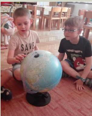
Ismerkedés a Földgömbbel