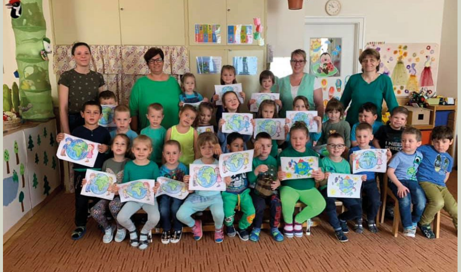
Föld napja a Katica csoportban