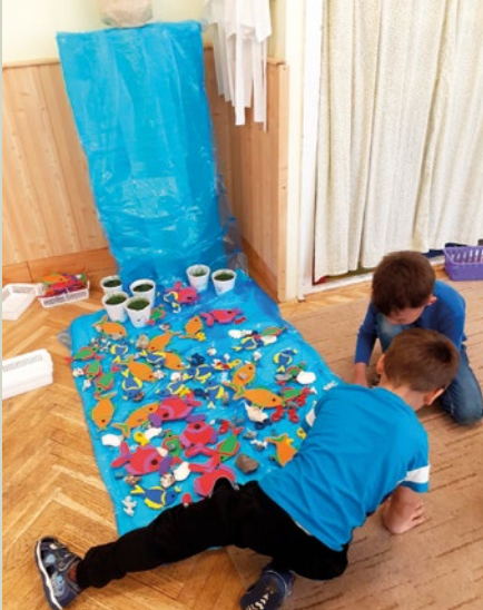
Víz világnapja az Őzike csoportban