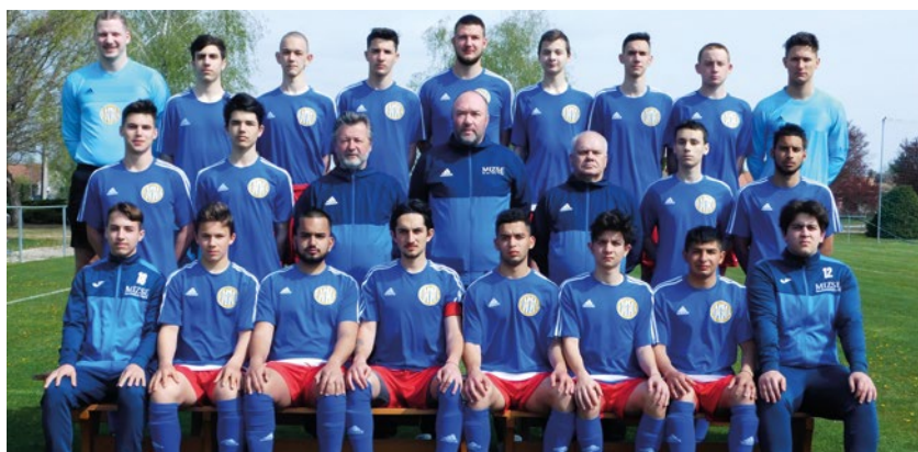
U19-es csapatunk