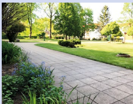
Munkálatokat követően az Idősek Pihenő Parkja

Nap keretein belül. Megtörtént továbbá a parkban található padok és a kutak festése/mázolása. Az Egészségház előtti közterületeket feltakarították, felpertétek, lenyírták a fűvet. A közterü-