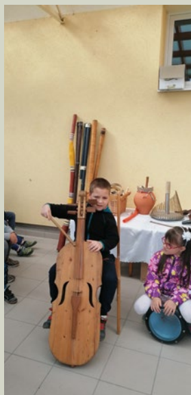
Hangszerbemutató a Mécses csoportban