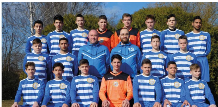
U16-os csapatunk