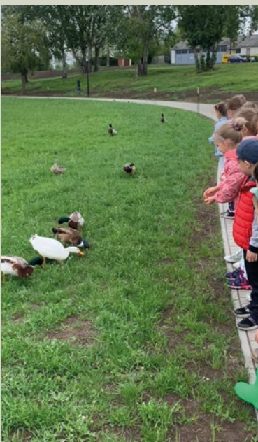
Kacsák etetése a tóparton