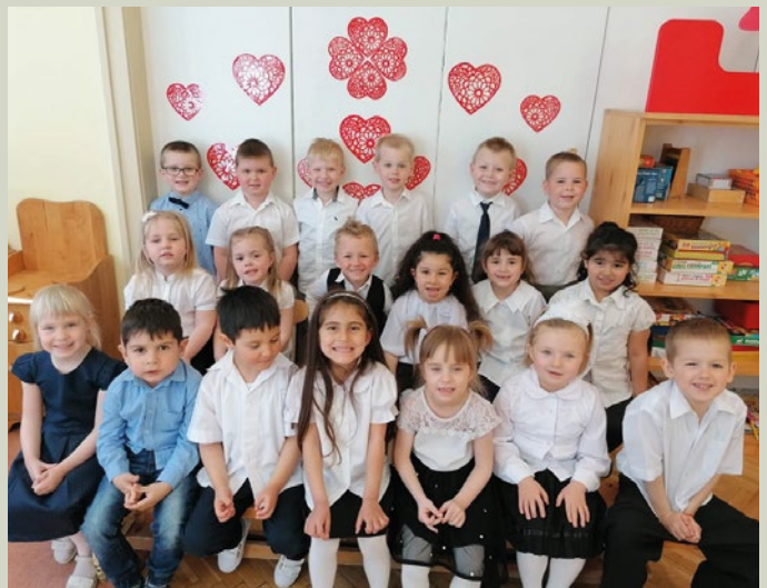
Anyák napja a Napocska csoportban