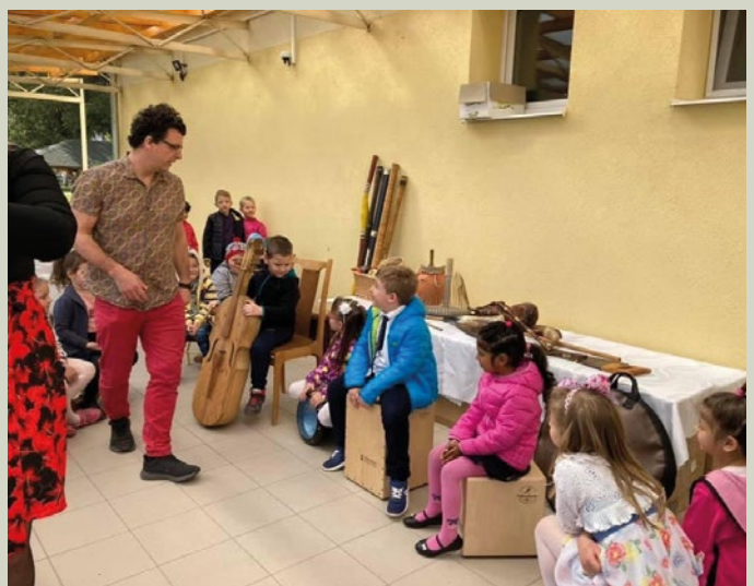
Ismerkedés a hangszerekkel