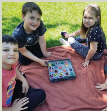
Újrahasznosítás, környezetvédelem Csibe módra