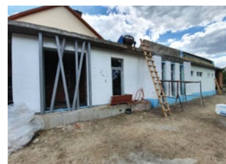
A bölcsőde terveit a Szimmetria Plusz Építésziroda Kft., Babinszky Tünde építésztervező készítette