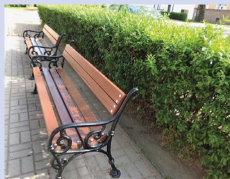
A közterületen található padok a felújítást követően

Idei évben az Egészségház munkatársai az Idősek Pihenő Parkjában virágosítást, fűnyírást, locsolást, gyomtalanítást, elszáradt fa helyébe faültetést/pótlást végeztek a Környezetvédelmi